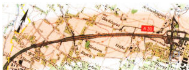
Rot = Belastungszone ca. 1000 m

Die Nordzerschneidung blockiert laut Gutachten die wichtigsten Kaltluftströme, die für den Luftaustausch im Werretal notwendig sind. Die Luft wird dicker, Schadstoffe bleiben im Talkessel.